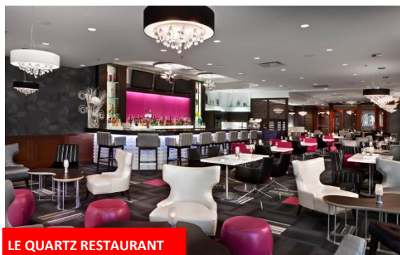
LE QUARTZ RESTAURANT