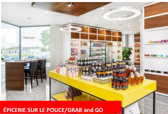
ÉPICERIE SUR LE POUCE/GRAB and GO